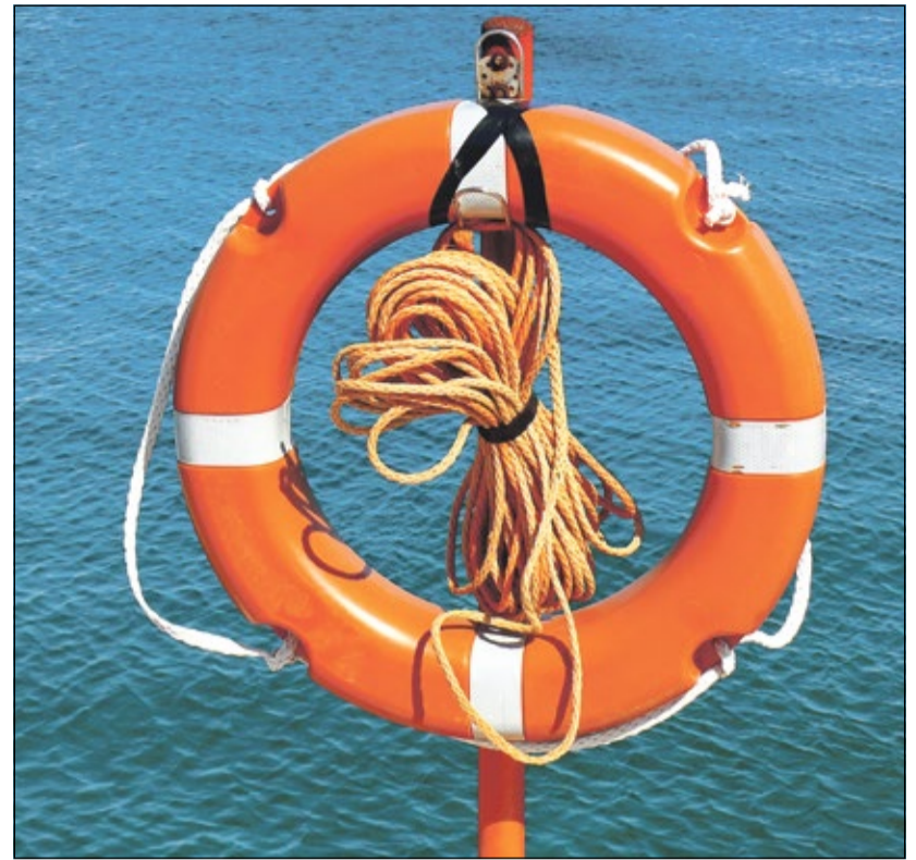
Die Berufsunfähigkeitsversicherung kann zumindest finanziell ein Rettungsring für Betroffene sein.

etwa bei gestiegenen Strompreisen in Biogasanlagen, kann trotz bestehender Police auf einem Großteil des Schadens sitzen bleiben. Aber auch für Berufseinsteiger, Azubis und Studierende gibt es wichtige Weichen zu stellen: Eine Berufsunfähigkeitsversicherung sollte so früh wie möglich abgeschlossen werden – nicht zuletzt, weil der gesetzliche Schutz in den ersten Berufsjahren schlicht fehlt und später oft geringer ausfällt als erwartet. Unsere Sonderseite zeigt, worauf es ankommt – damit Versicherungsschutz im Ernstfall auch wirklich greift. Ihr Ralf Dieckmann