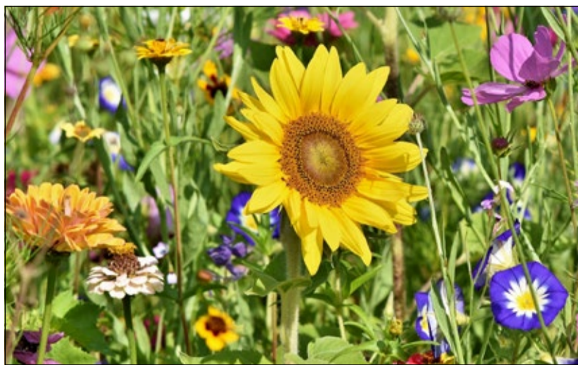
Für Blühstreifen und nicht produktive Flächen gibt es Anpassungen bei den Öko-Rege-lungs-Prämien.