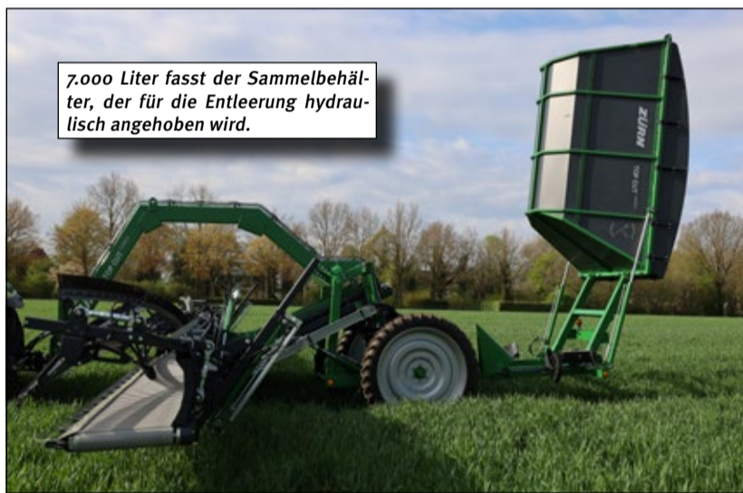
7.000 Liter fasst der Sammelbehälter, der für die Entleerung hydraulisch angehoben wird.

Wie ein Lohnunternehmer aus Leeste mit dem Zürn Top Cut Collect der Samenbank zu Leibe rückt