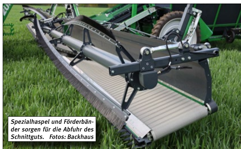
Spezialhaspel und Förderbänder sorgen für die Abfuhr des Schnittguts.

„Wir hoffen, dass sich dieses Verfahren schnell etabliert“, sagt Martens. „Der Druck auf den chemischen Pflanzenschutz wird nicht kleiner. Und wenn man Betrieben eine mechanische Option anbieten kann, die weiteres Ausamen verhindert, dann ist das ein echtes Argument - nicht nur für den Ökolandbau.“